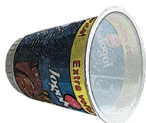
kelímek od jogurtu