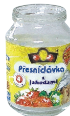
sklenička od přesnídávky