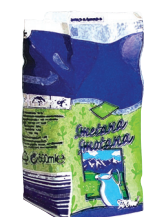
obal od šlehačky