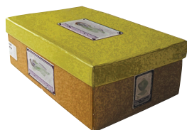
krabice od bot