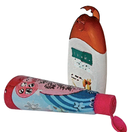
obaly od kosmetiky