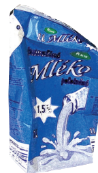
obal od mléka