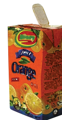
obal od džusu