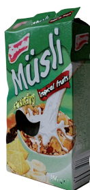
krabice od müsli