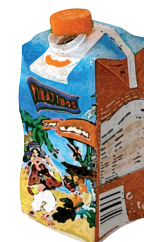
obal od malého džusu