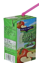
obal od pitíčka